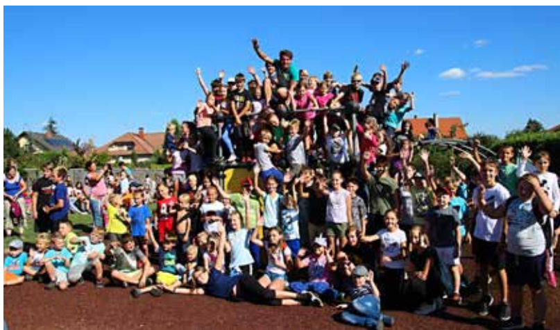
archivní foto 2019

Spolupodíleli jsme se na přípravě a koordinaci projektu. Otevření proběhlo v září 2018. Slavnostní slava třetích narozenin Adoparku se v roce 2021 neuskutečnila.